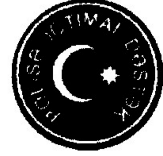
5. Dş nişanı