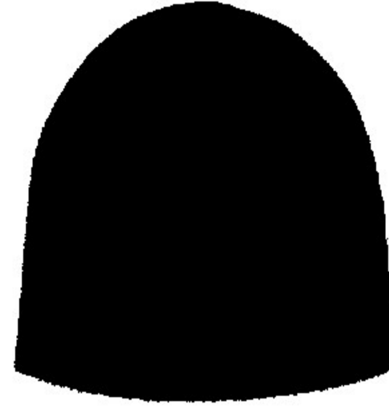
4. Qış papaęı