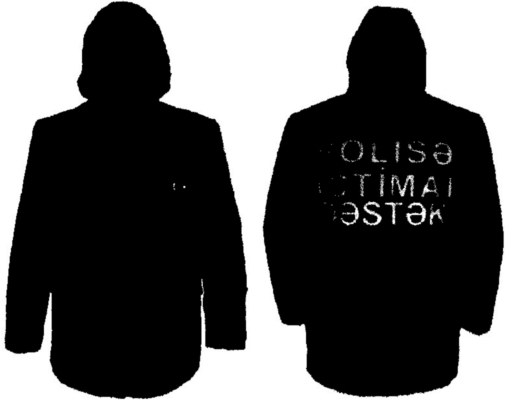
1. Qış gdekcesi