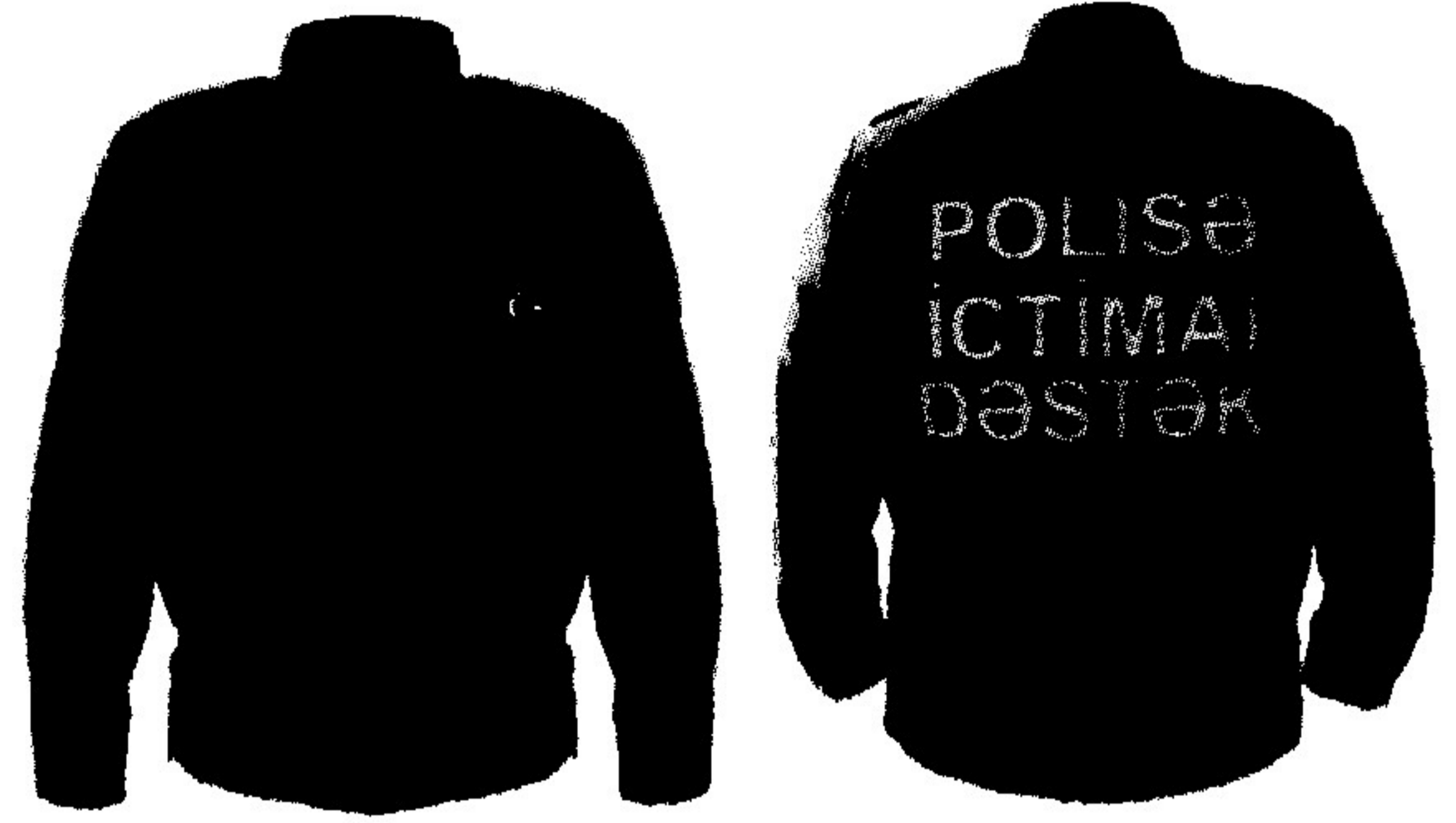
2. Yay gdekcesi