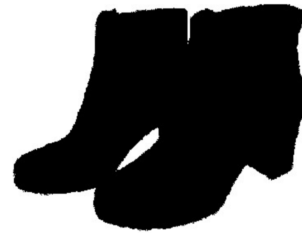
9. Qış ęekmesi (qadınlr uęn)