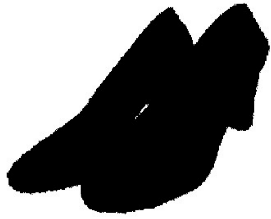
8. Gndelik ayaqqabı (qadınlr uęn)