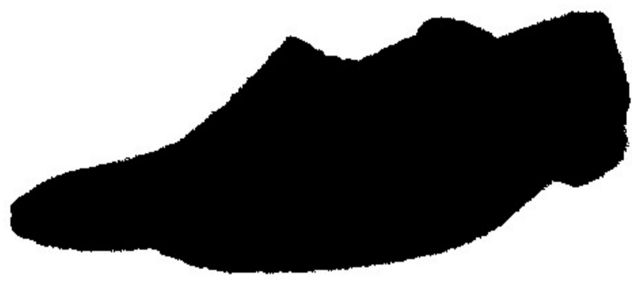
6. Gndelik ayaqqabı